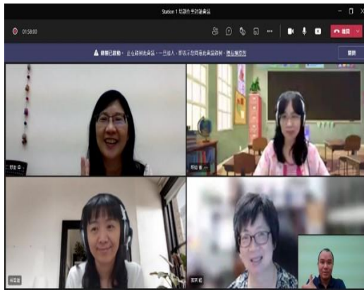
說明：參與培訓的老師們定期線上討論