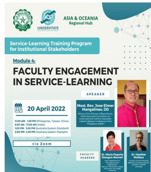
說明：UNISERVITATE Programme 計畫國際服務學習培訓課程 4