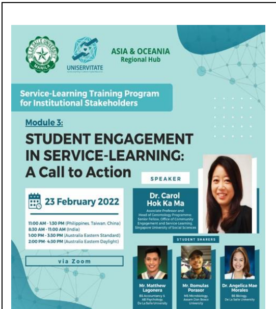
說明：UNISERVITATE Programme 計畫國際服務學習培訓課程 3