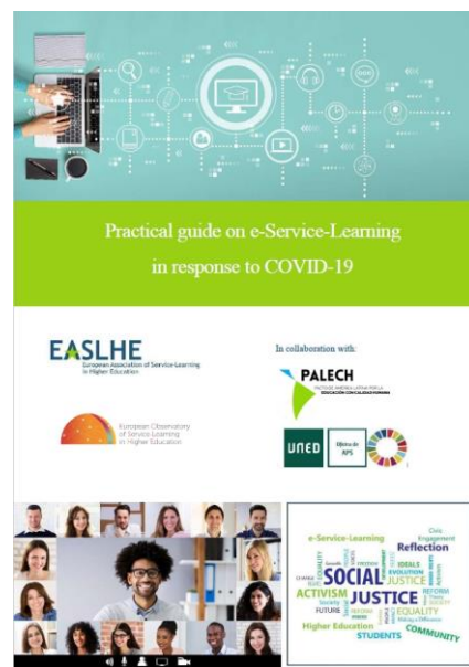
說明：UNISERVITATE Programme 計畫出版書籍- Practical guide on e-Service-Learning in response to COVID-19